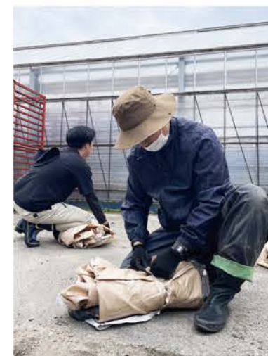
田植えに向けて準備するマルチワーカー

したらワークス協同組合は、愛知県で初めて「特定地域づくり事業協同組合」に認定されました。現在は、農業・観光・林業・福祉など、さまざまな分野の17事業者が組合に加入しています。