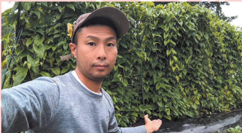
現在試験栽培しているガンコ芋

最近は新たな特産品開発を目指し、3種類の作物の試験栽培にも挑戦しています。特産品を通して、設楽町の魅力を発信し、地域がもっと元気になるよう活動を続けていきます。