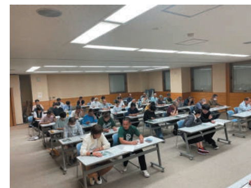
津具地区懇談会の様子