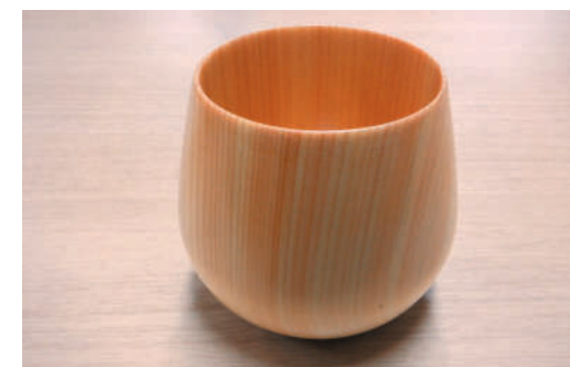
町産材製木製コップ