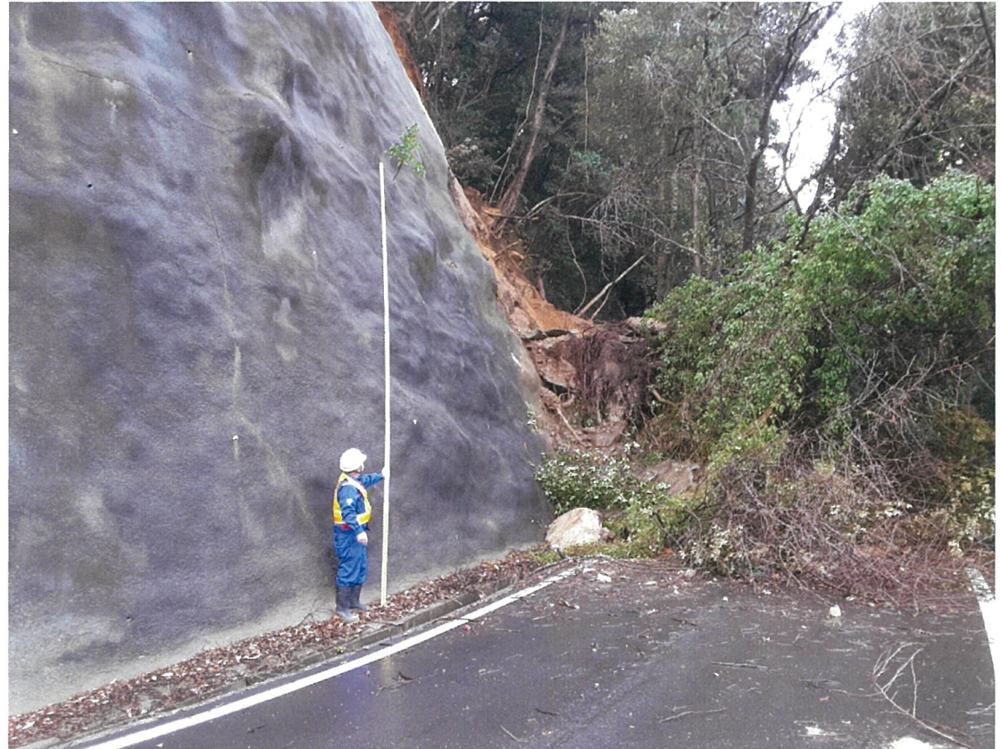
○道路班による現地調査 (七尾市内)