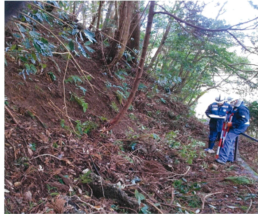
○輪島市にて被災状況調査【砂防班】