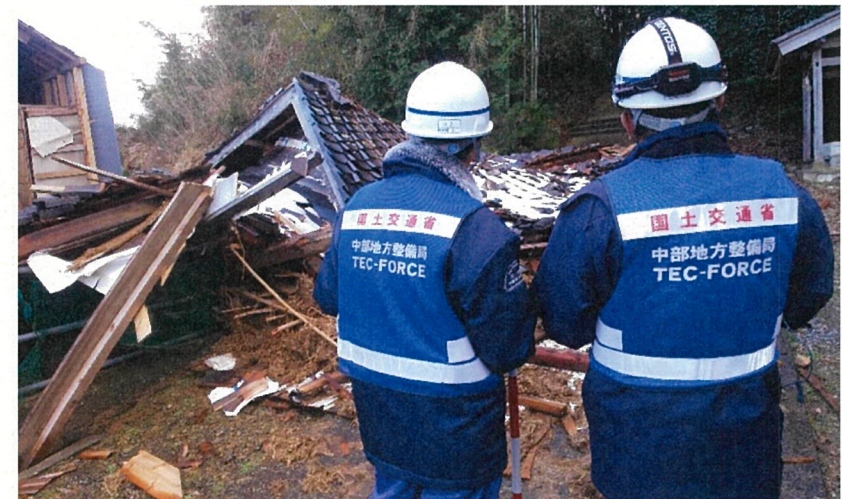
○輪島市二ツ屋町における調査【砂防班】