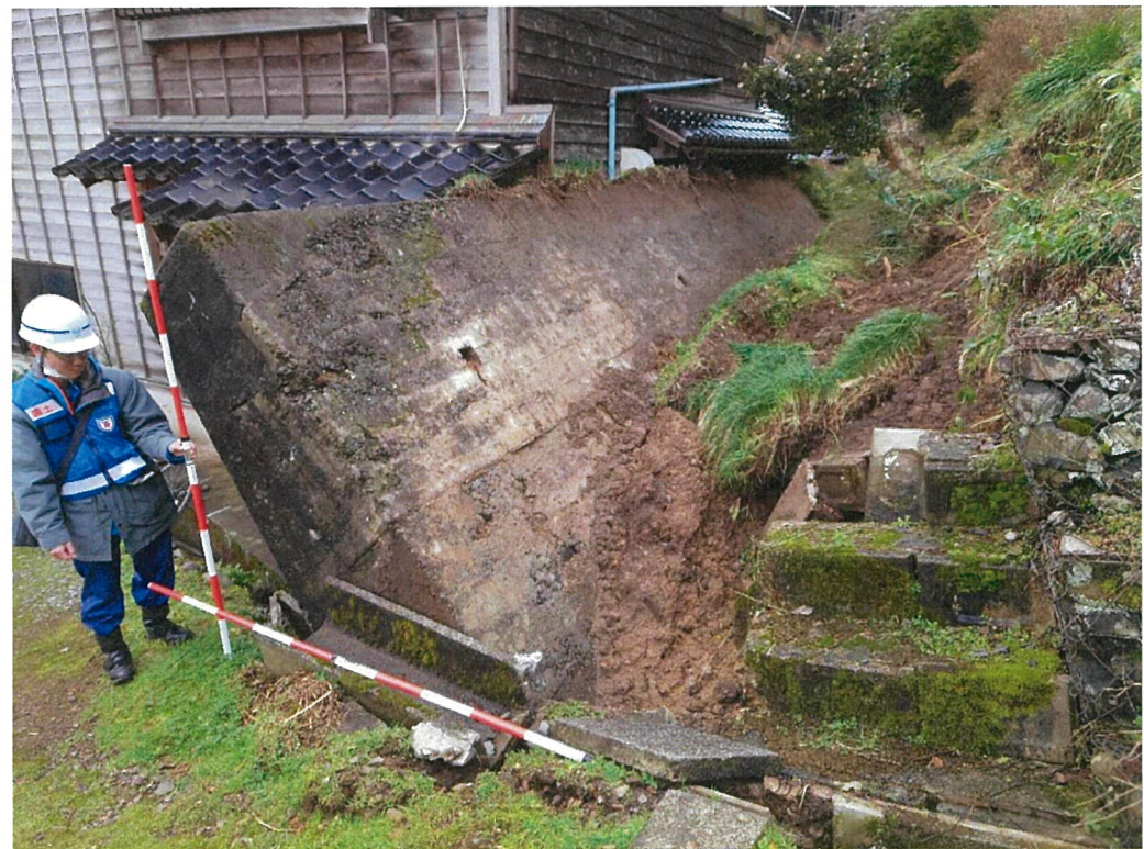
○輪島市における被害状況調査【砂防班】