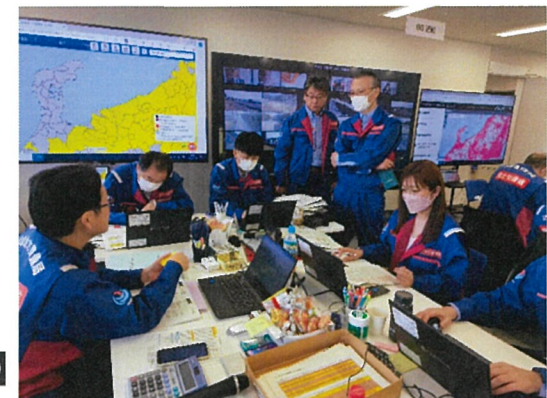
○北陸地整にて内業【先遣班】