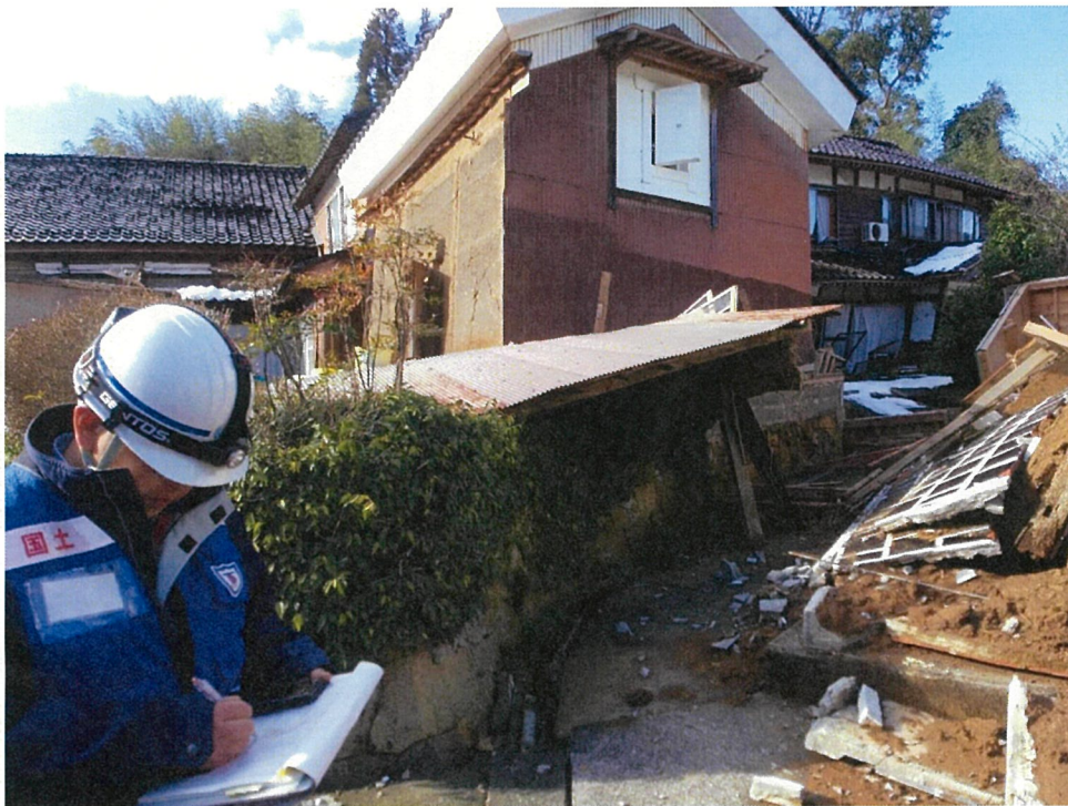
○輪島市宅田町における調査【砂防班】

本日（29日）の現地のTEC-FORCE（緊急災害対策派遣隊）の主な活動は以下のとおりです。