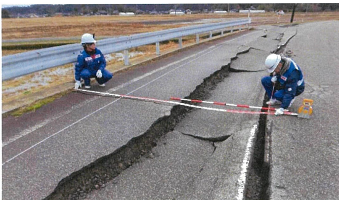
○珠洲市における被害状況調査【道路班】