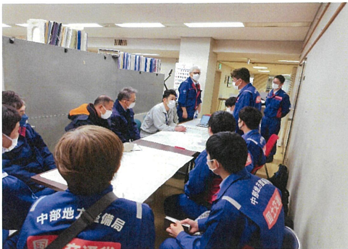
○道路班の打合せ(七尾市内)