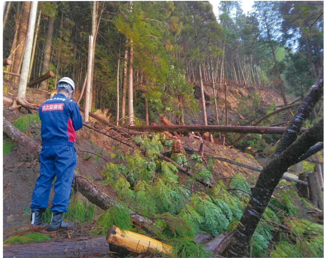
○砂防班による現地調査(輪島市内)