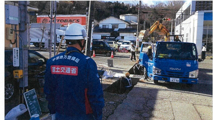
○七尾市藤橋町における調査【水道支援班】