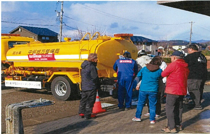
○応急対応班による給水支援(氷見市内)

本日(6日)の現地のTEC-FORCE(緊急災害対策派遣隊)の主な活動は以下のとおりです。