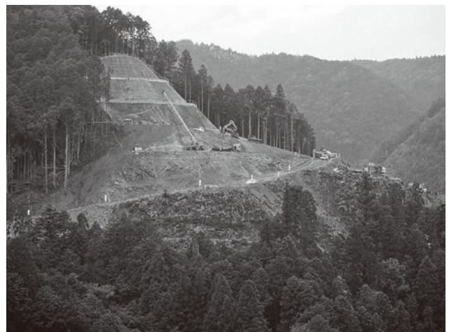
▲ 設楽ダム左岸側工事状況