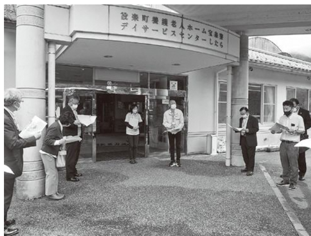
▲ 養護老人ホームやすらぎの里