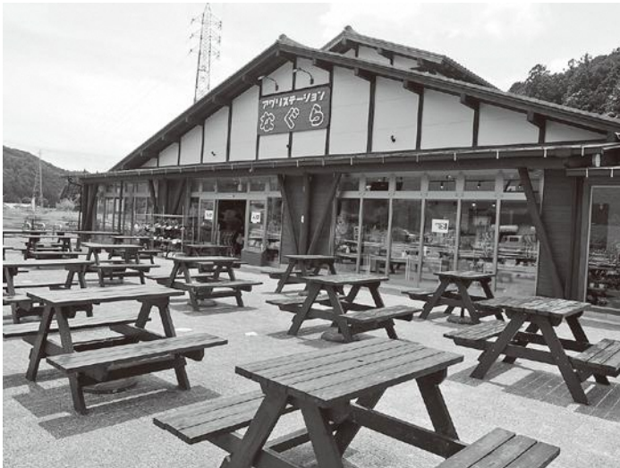
▲ アグリステーションなぐら全景