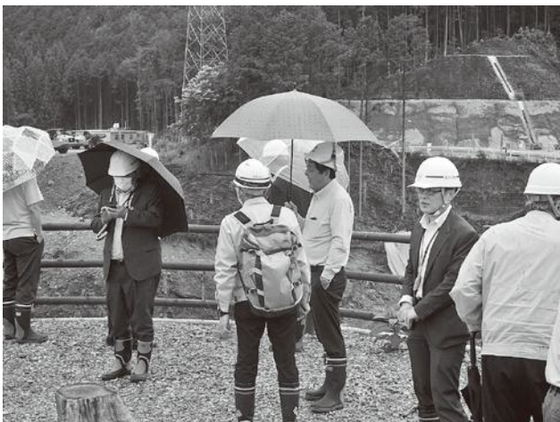
▲ 設楽ダム工事説明

委員会終了後、設楽ダム展望台から周辺工事の進捗状況を視察し、併せて大雨による被害状況などの説明を受けました。