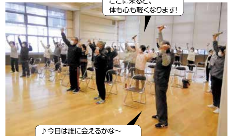
ここに来ると、 体も心も軽くなります!

「友達が増えた」「月一回みんなと会うのが嬉しい、元気をもらえる」「会ったことがない人とも話せる」と、人とのつながりも生まれ、元気の源になっています。