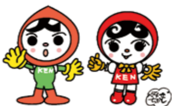
人権イメージキャラクター 人KENまもる君 人KENあゆみちゃん