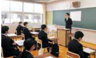
クラス開き(普通科)