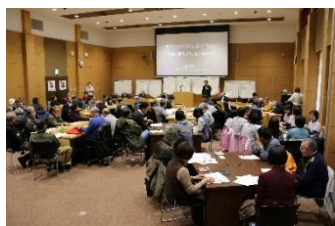
まちづくりシンポジウム