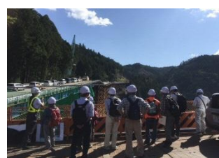
設楽ダム工事見学ツアー