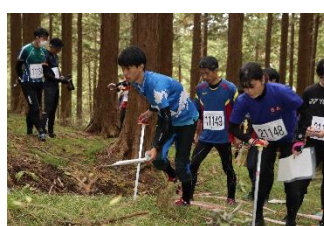
アウトドアスポーツイベント開催