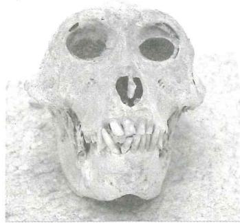
郷土館の厩猿(田内)

ものには繫ぎ止める杭や手綱を持つ猿が描かれていることが多くという特色があります。