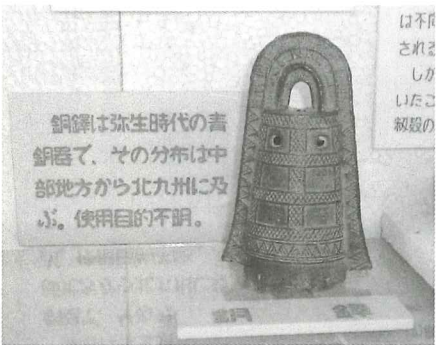
郷土館のレプリカ

郷土館一階、弥生時代の展示棚の中に、高さ十六cmほどの小さな銅鐸がある。残念ながらこれはレプリカで、実物は豊川市一宮町の砥鹿神社の宝物殿に、神宝として保管されている。昭和九年に重要美術品、昭和五〇年に愛知県文化財に指定されたものである。